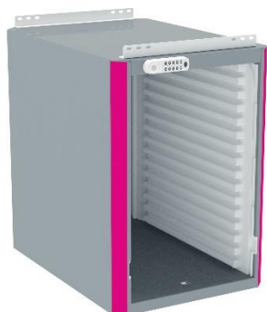
8Y547: Kit de suspension plan suspendu