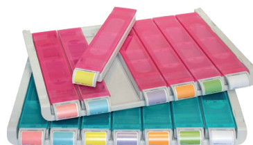
Plateau avec piluliers Modulo® XL