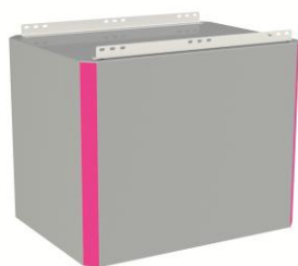
8Y546 : Kit de suspension plan tubulaire