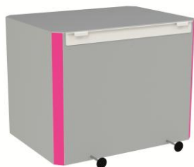
8Y545 : Kit de suspension plan suspendu